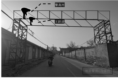
高处作业点位置示意图

经现场勘察,事故发生时所拆的管道过路桥架位置位于襄纺路原襄汾纺织厂女工楼东侧,其中管道东西方向大约长 11m,管道距离地面高度约 5.3m,3 种管道共 6 根;顶部支架东西方向长 10.07m 左右,支架高度 0.7m,宽度为 2.56m。