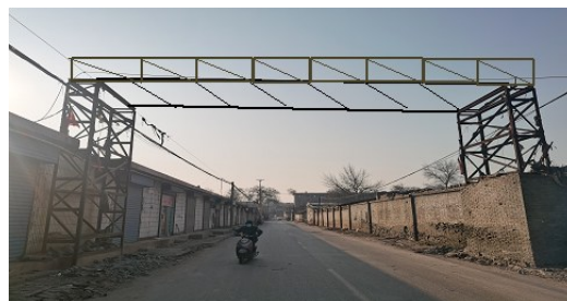
襄纺路纺织厂生活区管道过路桥架外观尺寸及高处作业点位置示意图